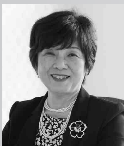
自然科学研究機構・機構長