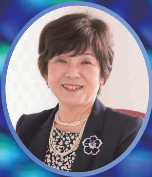
自然科学研究機構・機構長